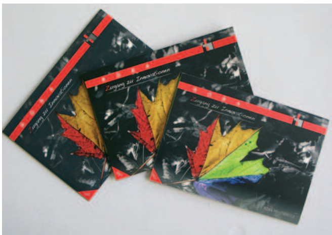
Ein gutes Blatt. ROBA bietet einen umfassenden Druckservice mit Flexo-, Offset- und Digitaldruck aus einer Hand.