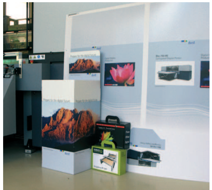
Vielfältige Wellpappenverpackungs- und Displayproduktion